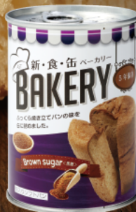
黒糖 黒糖独特の風味を楽しめる 深い味わい。