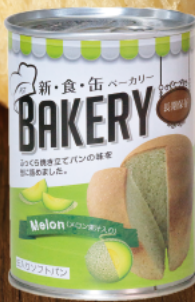
メロン果汁入り メロンのやさしい甘さと 豊かな香り!