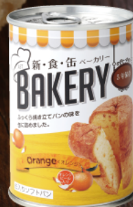
オレンジ オレンジピールがアクセント! 爽やかな柑橘系フレーバー。