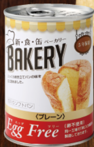
Egg Free プレーン 原材料として、卵不使用。 ほのかな甘みのあるプレーン味。